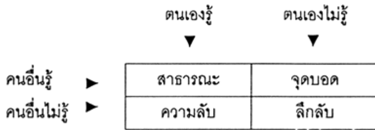
ภาพประกอบที่ 2-2 ภาพแสดงหน้าต่างหัวใจของโจเซฟ และแฮรี่

จากภาพแสดงหน้าต่างใจแฮรี่ได้อธิบายลักษณะและความสัมพันธ์ของบุคคลว่ามี 4 ลักษณะ ดังนี้